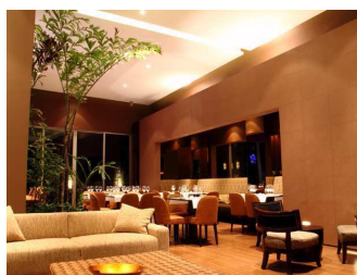
Cabrera Imperial - Bogotà