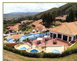
El Duruelo - Villa de Leyva