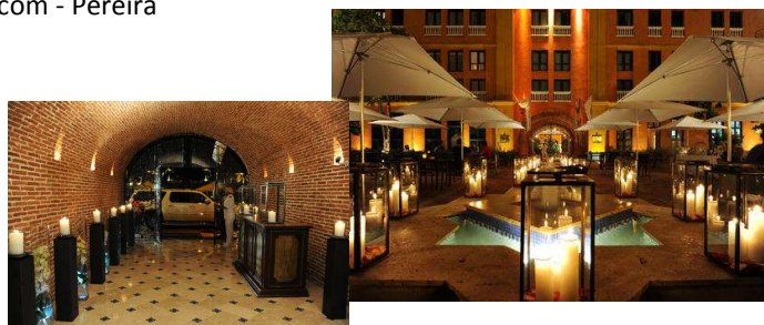
Charleston Santa Teresa - Cartagena