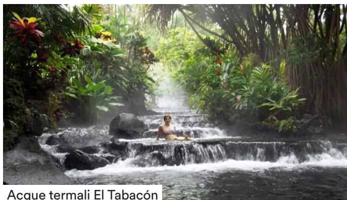
Acque termali El Tabacón