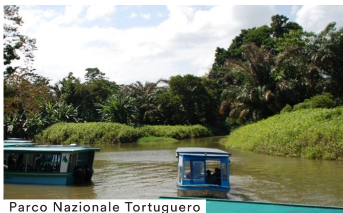
Parco Nazionale Tortuguero