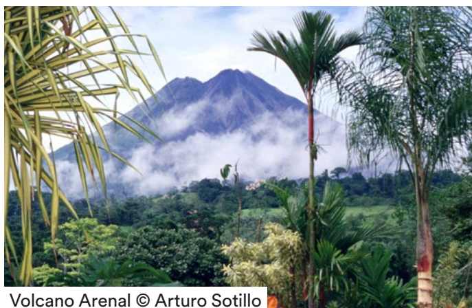
Volcano Arenal

Pernottamento > Hotel Los Lagos, camera Superior.